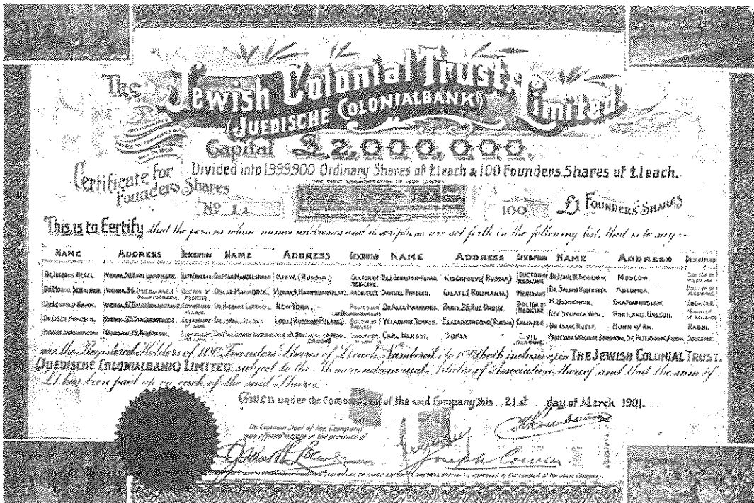
מניית יסוד של "אוצר התיישבות היהודים". במקום 2 מיליון ליש"ט ריכזה התנועה הציונית רבע מיליון ליש"ט בלבד

שאינו מעמיד אשראי לטובת פרויקטים לא תמיד ריאליים של התנועה הציונית. ואולם, חקר תולדות הבנק מלמדנו שהוא מילא תפקיד מהותי בייסוד תל אביב, בתמיכה ביישוב היהודי בתקופת מלחמת העולם הראשונה ובהקמת המערכת המוניטרית של מדינת ישראל. מעצם אופיו של הבנק היו פעילויות אלה רחוקות מאוד הזרקורים. סקירה ביוגרפית של הדמויות שייסדו או שניהלו את הבנק ואת סניפיו הראשונים תגלה את הקשר הלא ייאמן בין הבנקאות לעתונות, לספרות ולחיי הרוח. כמעט כל האישים מהצמרת הניהולית של הבנק היו מעורבים בתקשורת של אותם הימים. תקשורת זו התבטאה בעיקר במדיום